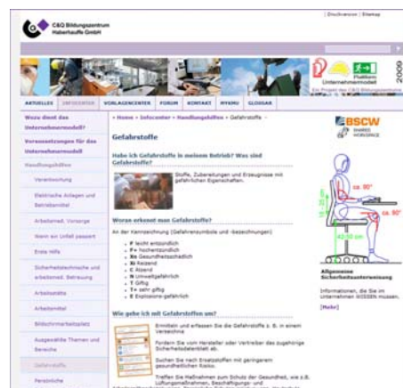
Abb. 5: Allg. Bereich „Handlungshilfen“, hier zum Thema Gefahrstoffe mit allen für den Unternehmer relevanten Infos.