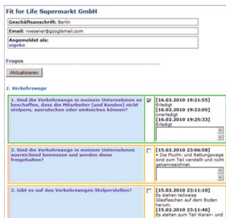
Abb. 2: Checkliste zur Gefährdungsbeurteilung, ein Farbmodell ermöglicht eine schnelle Übersicht – grün = „erledigt/OK“, orange = „in Bearbeitung befindlich“, rot = „noch offen, nicht bearbeitet“