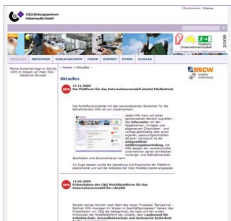
Abb. 4: In der Rubrik „Aktuelles“ werden die Unternehmer über wichtige Neuerungen sowie allgemein zu beachtende Termine und Fristen informiert.