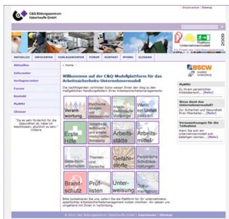
Abb. 1: Startseite der Plattform mit den 16 wichtigsten Handlungsfeldern des Arbeitssicherheitsmanagement im Schnellzugriff (4x4-Matrix)

Hier setzt die C&Q-Modellplattform für das Arbeitssicherheits-Unternehmermodell an: Auf einer zentralen, webgestützten Plattform können Unternehmer in einem gemeinsamen Bereich auf alle für sie relevanten Informationen zugreifen. Passwortgeschützt steht ihnen außerdem ein unternehmensspezifischer Arbeitsbereich zur Verfügung, in dem sie u. a. online die Checkliste zur Gefährdungsanalyse ihres Unternehmens bearbeiten, dokumentieren wie auch ihre Unterweisungen nachweisbar einstellen können. Zur Sicherheit des Unternehmens und seiner Mitarbeiter.