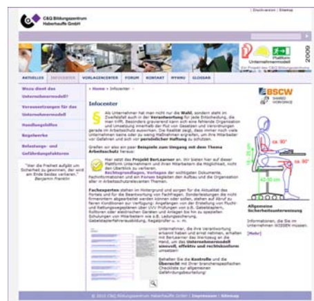
Abb. 3: „Infocenter“ mit allen wichtigen Informationen betreffend das Unternehmermodell, Vorlagen, Richtlinien etc.